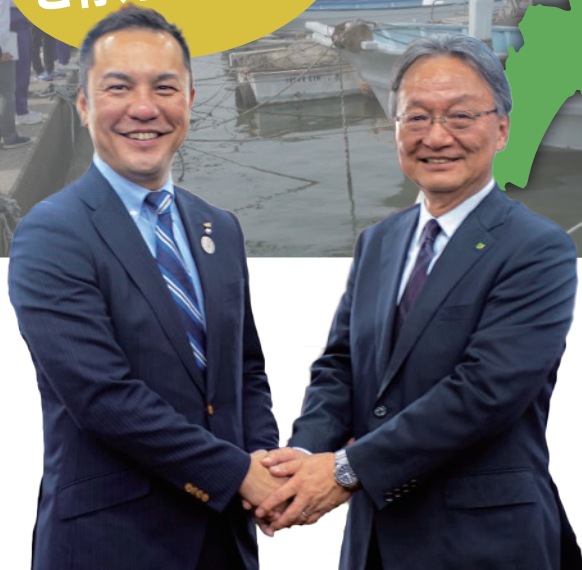
三重県知事 鈴木 英敬