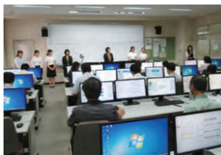
講師とボランティア学生紹介

※「やわらか心」＝全ての人を尊重し、その個性・価値観を受け入れることのできる、和らいだおらかな心のこと